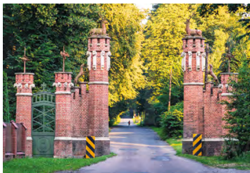
Brama Zwierzyniecka

Wysoka na 25 m wapienna skala z wyrytymi na niej historycznymi napisami wznosi się niemal pionowymi ścianami przy drodze wojewódzkiej nr 774 i objęta jest ochroną w formie rezerwatu o tej samej nazwie. Według legendy miał się z niej rzucić nieszczęśliwie zakochany w córce ówczesnego właściciela Balic rycerz Kmita.