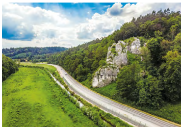
Skala Kmita