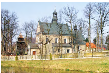
Kościół w Tenczynku