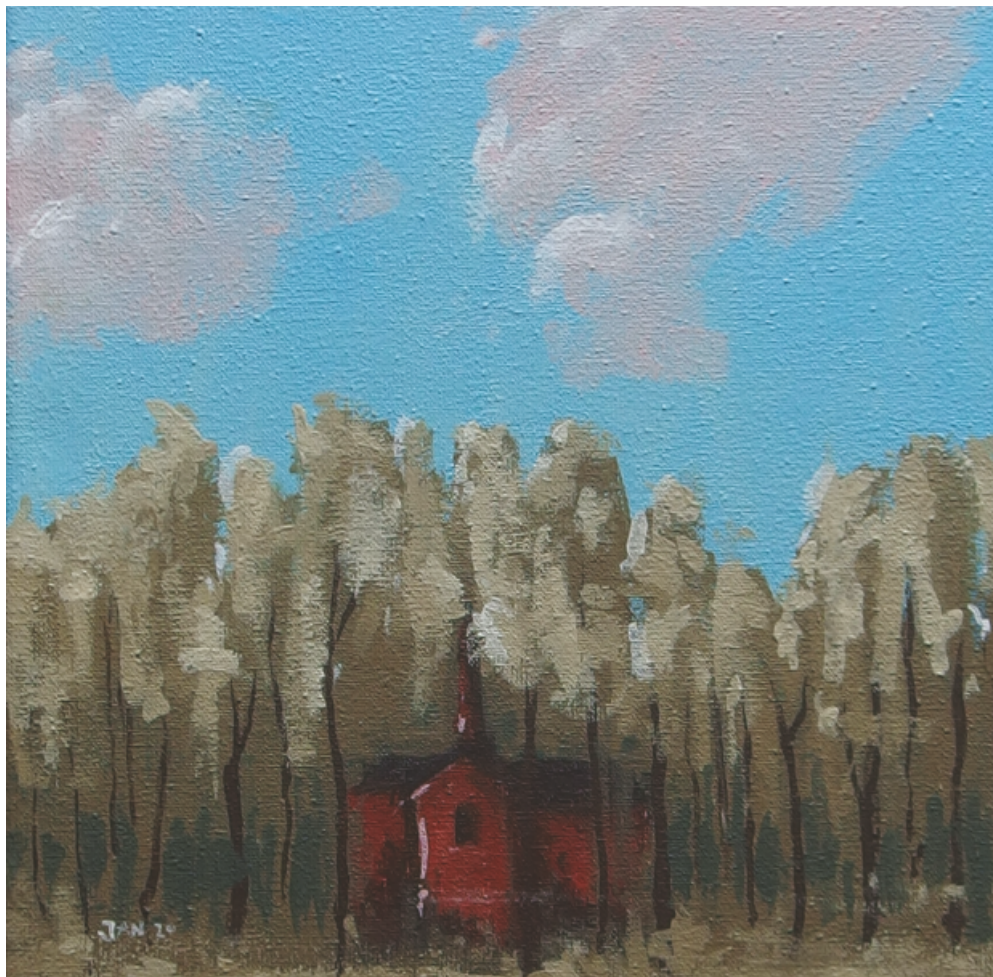
W błękitnie - akryl 20x20

Ważne wydarzenie 2019 – wydanie albumu pt. Dekameron ze 130 rysunkami wg Boccaccia; premiera albumu oraz wystawa rysunku w Galerii na Piętrze w Słomnikach oraz w Centrum Wiara i Kultura w Hebdowie.