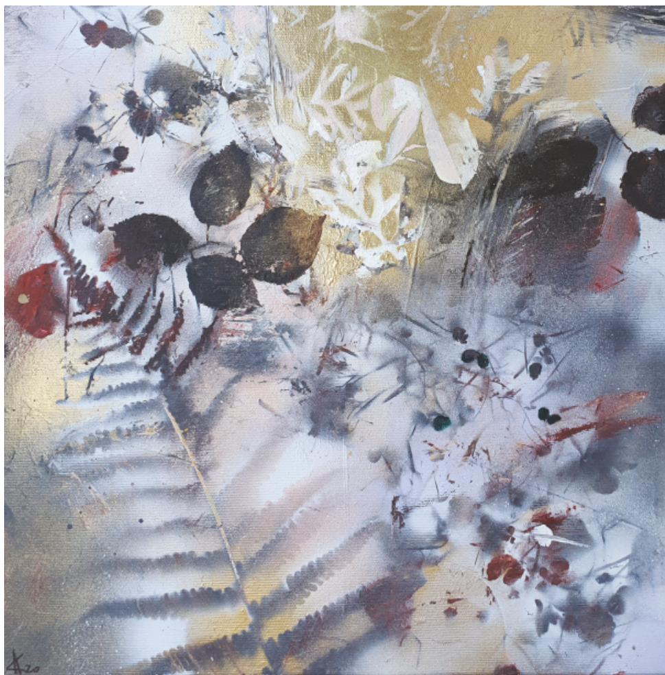
Summertime - spray 40x40

Uczestniczyła w plenerach międzynarodowych w Polsce, Słowacji, Niemczech i na Ukrainie.