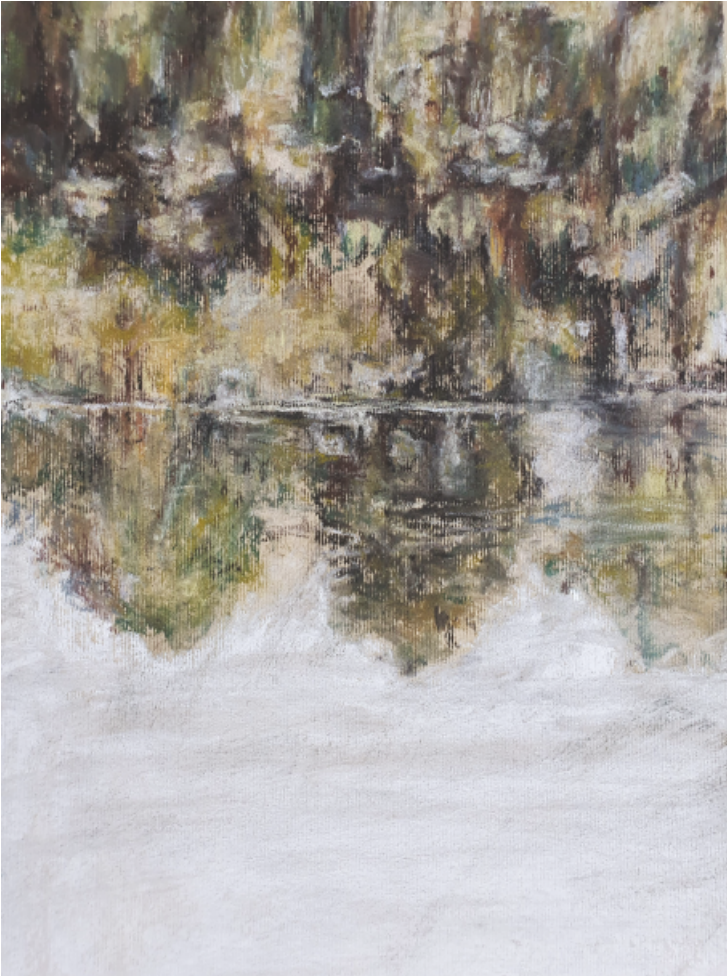
Bez tytułu - pastel 20x15

Urodziła się na Mazurach. W 1997 roku rozpoczęła studia na Europejskiej Akademii Sztuk na Wydziale Grafiki. Z przyczyn życiowych jej nie ukończyła. Jej działalność plastyczna jest różnorodna. Zajmuje się projektowaniem mebli, malarstwem i rzeźbą. Na twórczość malarską wpływ ma chęć czynienia świata bardziej ciepłym i przyjaznym. W pracach rzeźbiarskich przez dialog z historią i postawę pacyfistyczną stara się utrwalać piękno ponadmaterialne. Jej meble ma cechować użyteczność i estetyka, ale przemycą też żart.