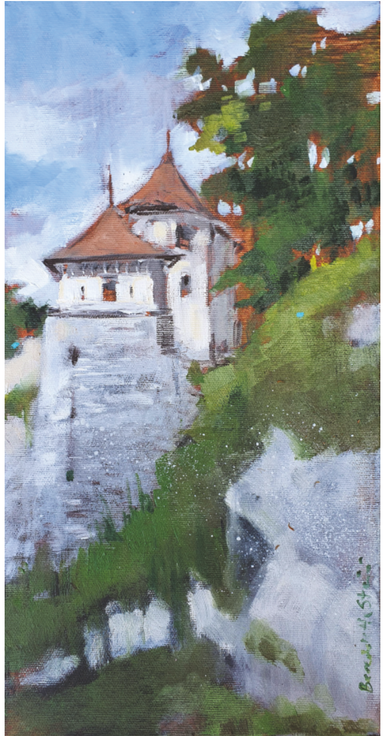
Zamek w Ojcowie - olej 40x20

Była kuratorem kilku plenerów malarskich, w tym w 2013 roku Pleneru w ramach Międzynarodowego Festiwalu Pasteli w Nowym Sączu. Od ubiegłego roku jest prezesem Stowarzyszenia Pastelistów Polskich.