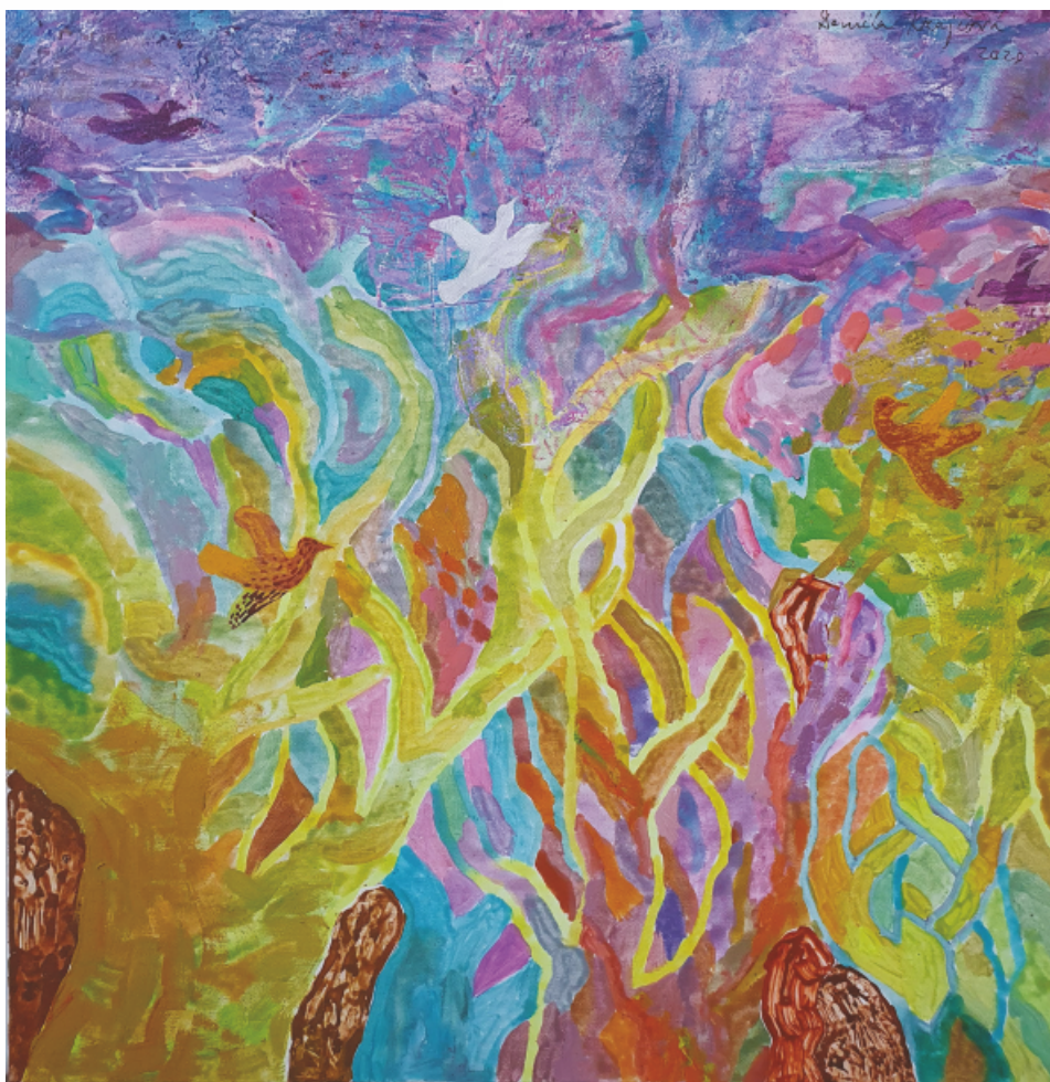
W ogrodzie - akryl 60x60

Ukończyła Akademię Sztuk Pięknych w Bratysławie na kierunku Malarstwo Monumentalne. Jej obrazy są pełne fantazji, nie dąży do doskonałości realizmu, nie ulega modnym trendom, daje prowadzić się własnej twórczej wolności. Tworzy rysunek artystyczny, grafikę, zajmuje się też rzeźbą i ceramiką. Wspaniałe malarskie kompozycje monumentalne są zrealizowane w Rajeckich Teplicach, Budkovcach, Žilinie. Autorka kilkudziesięciu wystaw indywidualnych i zbiorowych. Za twórczość ilustratorską, oryginalny styl rozwijający wyobraźnię dziecięcego czytelnika otrzymała nagrodę Ludovita Fullu. Mieszka i tworzy w Žilinie.