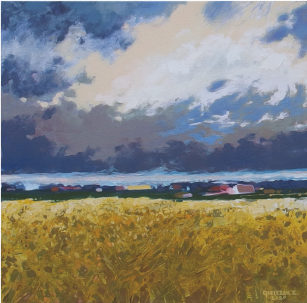
Nad miastem - akryl 40x40