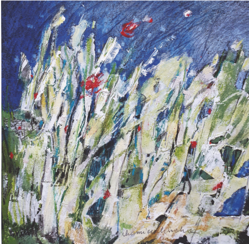
Trawy - tech. mieszana 30x30

Urodzona w Sulęcinie. Jest absolwentką PLSP w Poznaniu. Studia w PWSSP w Poznaniu, dyplom w 1980 roku. Jest współzałożycielką Galerii Sztuki Współczesnej PROFIL, CK ZAMEK w Poznaniu. Uprawia malarstwo olejne, pastel oraz malarstwo na jedwabiu. Jest członkiem Stowarzyszenia Pastelistów Polskich, Związku Polskich Artystów Plastyków, Stowarzyszenia Marynistów Polskich, Eko - Artu oraz Strefy Wyobraźni. Udział w wielu wystawach indywidualnych i zbiorowych w kraju i zagranicą. Laureatka Nagrody Konkursu „Pejzaż Wielkopolski - Eko 2006, 2007, 2008, 2012 Leszno” oraz Nagrody „Sacura Prize” IV Międzynarodowe Biennale Pasteli Nowy Sącz 2008. Prace w zbiorach muzealnych w kraju i zagranicą.