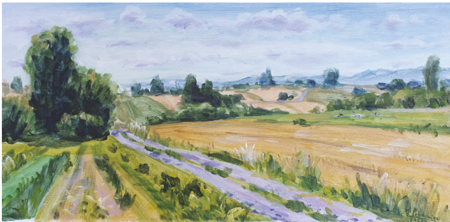
Okolice Krzeszowic - akryl 30x60

Brał udział w wielu edycjach Międzynarodowego Biennale Pasteli w Nowym Sączu, Międzynarodowym Biennale Pasteli w Oviedo w Hiszpanii, w Ogólnopolskim Triennale z Martwą Naturą oraz licznych wystawach zbiorowych w Niemczech i Francji.