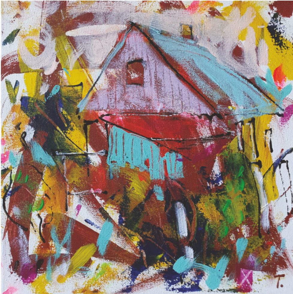
Cukrik - akryl 20x20

W swojej pracy skupia się na malarstwie, fotografii i sztuce wideo. Prezentuje również swoje prace konceptualne na wystawach na całym świecie. Jest stałym uczestnikiem plenerów artystycznych w kraju i za granicą. Wystawiał na Słowacji, Węgrzech, Ukrainie, w Polsce, USA, Indiach, Rumunii, Bośni i Hercegowinie, Słowenii oraz w Czechach na wystawach indywidualnych i zbiorowych.