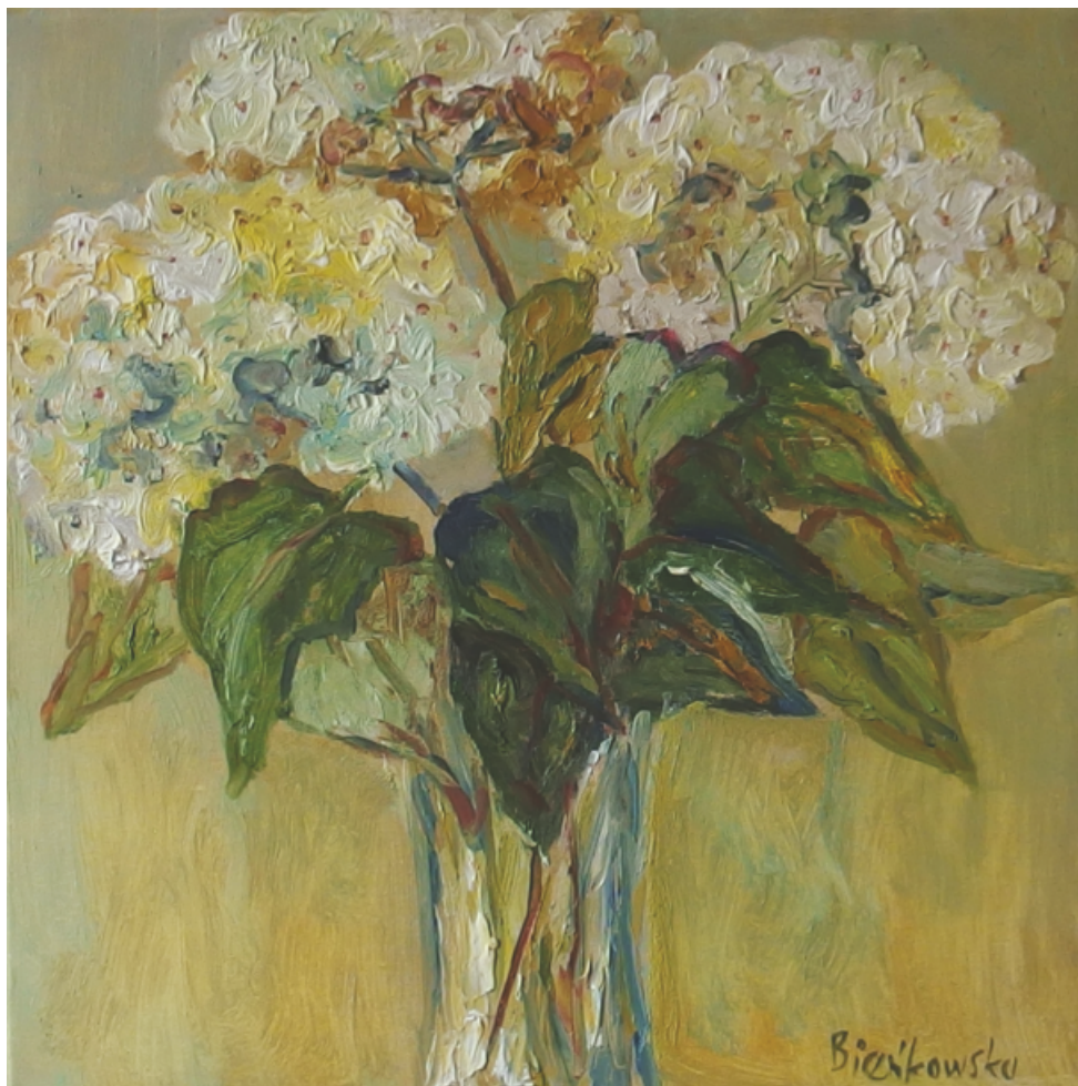
Hortensje - olej 40x40

Od 1980 r. jest członkiem Związku Polskich Artystów Plastyków. Z licznych podróży po świecie czerpie inspiracje dla swojej twórczości. Uczestniczyła w wielu plenerach i warsztatach artystycznych w Polsce, Francji, Włoszech, Turcji, Grecji, Norwegii i na Węgrzech. Z tych podróży powstały duże cykle malarskie: „Carrara – Kamienie światła”, „Senia”, „Fiordy”, „Ścieżki Bretanii”, „Morza”, „Ptaki”, „Rzeki”, „Wodne odbicia”, „Łąki”. Maluje pejzaże, kwiaty, martwe natury, ptaki, zwierzęta, postacie. Obrazy jej były wielokrotnie nagradzane i wyróżniane.