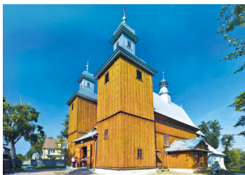
Kościół w Iwanowicach

Drewniany kościół pochodzi z 1745 r. We wnętrzu zachowało się cenne wyposażenie z XVI-XVIII w.: rzeźby Madonny i św. Krzysztofa z końca XV w. i ołtarz z 1 poł. XVII w. W bocznym ołtarzu znajduje się obraz Matki Bożej Śnieżnej z XVII w.