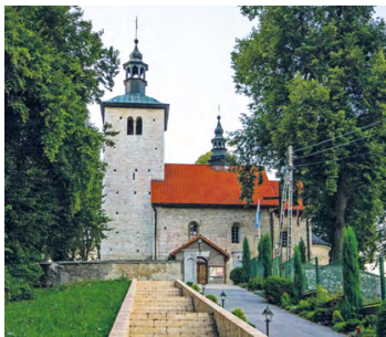
Kościół w Wysocicach, fot. Michał Sośnicki

Niezwykle cenny kościół romański, o obronnym charakterze, wzniesiony z kamiennych ciosów na przelocie XII i XIII w. Zachował się w praktycznie niezmiennym stanie. Szczególnie cenne jest wyposażenie: w szczycie prezbiterium rzeźba Matki Bożej z Dzieciątkiem na tronie, tympanon południowego portalu, a w wieży dwudzielne arkadowe okna z kolumnkami.